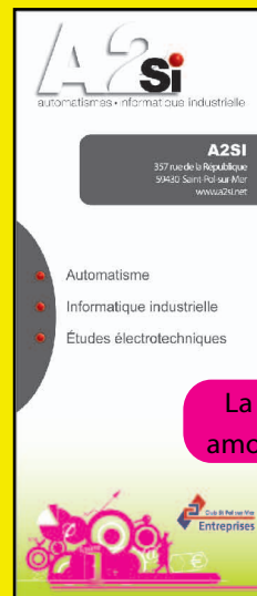
La PLV amovible