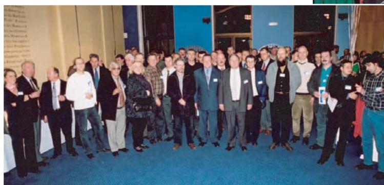
13 Nov. 03 - Participation du Club à la 1ère rencontre des Clubs d'entreprises à la CCID