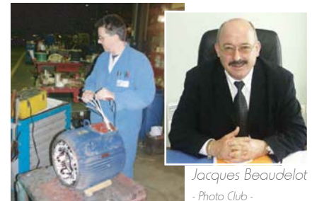
Jacques Beudelot - Photo Club -