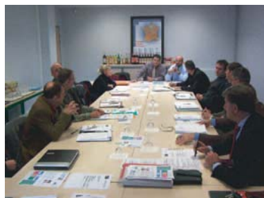
AG du 20 octobre chez Bossu Cuvelier