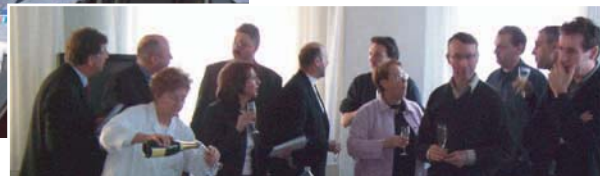
Le moment de convivialité !