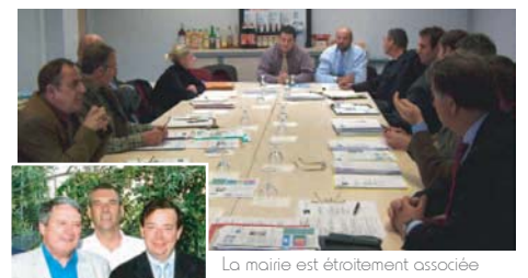
La mairie est étroitement associée à la vie du Club...

une évidence, mais au quotidien cela permet de résoudre pas mal de problèmes et de faciliter la vie des entreprises. Grâce aux efforts conjugués des partenaires publics et privés, les zones d'entreprises de Saint-Pol-sur-Mer ont considérablement évolué ces dernières années. Elles sont désormais plus qualitatives et attractives. La preuve, aujourd'hui il ne reste quasiment plus de terrain disponible. Bien entendu, nous avons encore du chemin à parcourir, mais nous sommes là pour ça !"