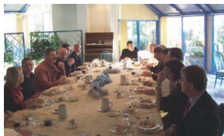
Le repas de fin d'année