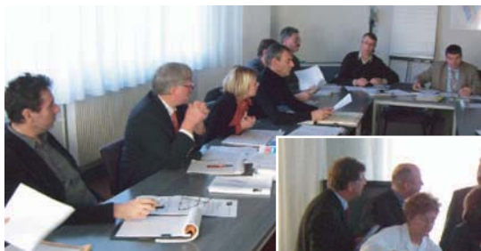
AG du 18 décembre chez Beaudelot REF - Photos Club -