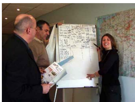
Janv 04 - Réunion de la commission communication sur la signalétique - Photos Club -