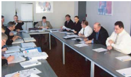
Assemblée plénière du 18 Décembre.

La commission a lancé avec le Club Tétheghem Entreprendre une consultation commune de prestataires en signalétique. Un document de synthèse des besoins pour les deux zones a été envoyé en décembre et les responsables des commissions des deux clubs ont collecté les différentes propositions. Celles-ci ont été étudiées en détail et les prestataires sélectionnés présenteront le 20 février leur offre aux membres des deux clubs pour choix définitif.