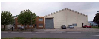
Linéaire - Le 27 Février 2008