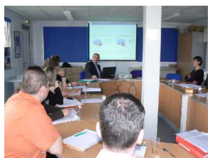
Sogéa Caroni - Le 23 Avril 2008